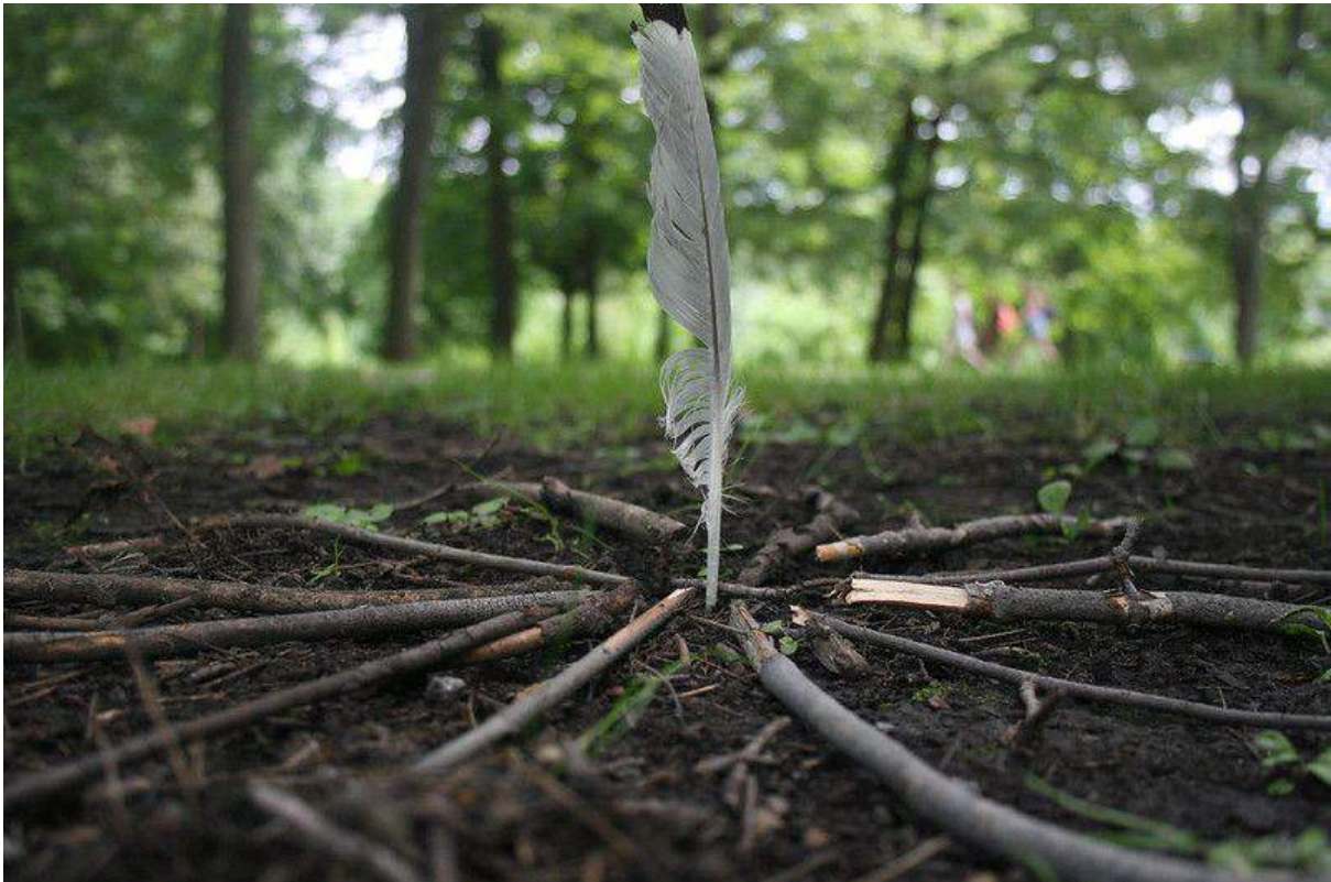
Comment réaliser un Land-Art Retraite slow en famille - Une Vie Slow